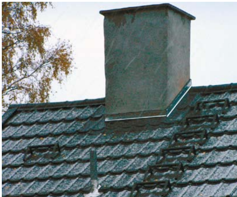
Traditionel muret skorsten, hvor der kan monteres allikerist eller der kan monteres aftrækssikring på selve kedlen.

Monteres der en foring i eksisterende skorsten, bør der anvendes materialer, der er modstandsdygtige over for korrosion i oliefyrede anlæg. Det er typisk rust- og syrefaste stålkvaliteter eller keramiske materialer. Hulrummet mellem foringen og skorstenen bør ikke fyldes med for eksempel lecagranulat eller lignende. Udfyldning vil forhindre den frie bevægelighed for foringen (termiske ekspansion) og vil kunne blokere aftrækket, hvis foringen angribes af korrosion. På gasfyrede anlæg har det i mange år været forbudt at fylde hulrummet – noget der også burde overvejes på olie- og fastbrændselsfyrede anlæg.