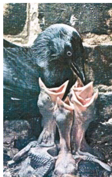
En grund til blokering af skorstenen kan være en allikerede.

Det har været almindeligt at betragte oliefyring som sikker i forhold til risikoen for kuliltefor-