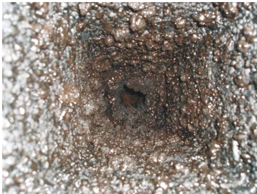
Kraftig tilsodet skorsten.

giftning – logikken skulle være, at man kan lugte røgen.