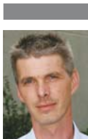
Af Michael Strøm Kierulff a/s

Med nogle enkle forholdsregler kan ulykkerne undgås. En af mulighederne er aftræksikring, som har været anvendt på gasfyrede anlæg i over ti år